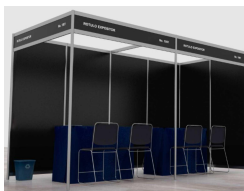
Diseño sujeto a cambios sin previo aviso

Está equipado con luces, 2 mesas, 6 sillas, alfombra y marquesina.