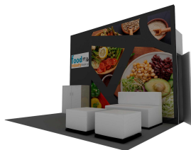
Diseño sujeto a cambios sin previo aviso

Está equipado con un muro con gráfico impreso, bodega con puerta y llave, 1 counter con gráfico impreso, 1 sillón doble y 2 taburetes.