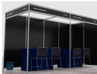
Diseño sujeto a cambios sin previo aviso

Está equipado con luces, 2 mesas, 6 sillas, alfombra y marquesina.