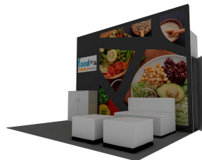
Diseño sujeto a cambios sin previo aviso

Está equipado con un muro con gráfico impreso, bodega con puerta y llave, 1 counter con gráfico impreso, 1 sillón doble y 2 taburetes.